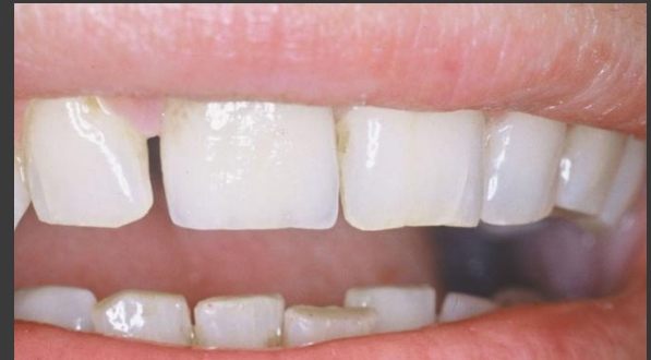
VMK Krone 11