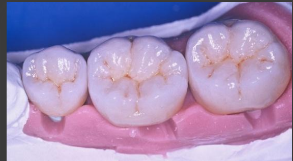
VMK Kronen auf 47 46 45